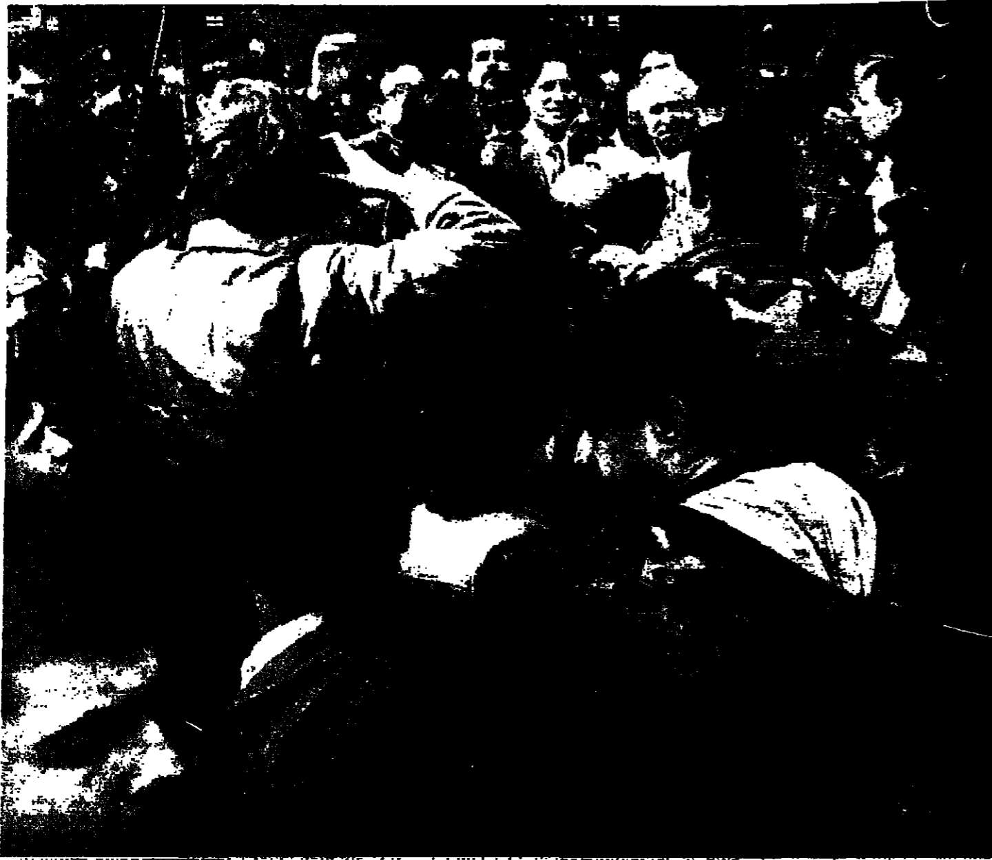
الرئيسان الجميل وكرامي وسط الحشود